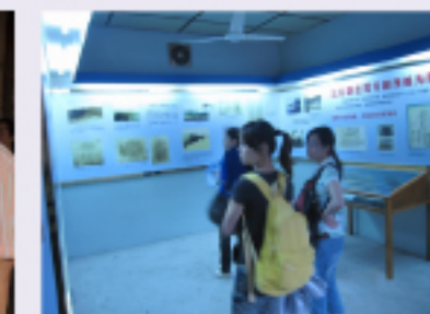
广通劳务党总支组织党员赴余姚参观四明山革命根据地,并重温入党誓词。