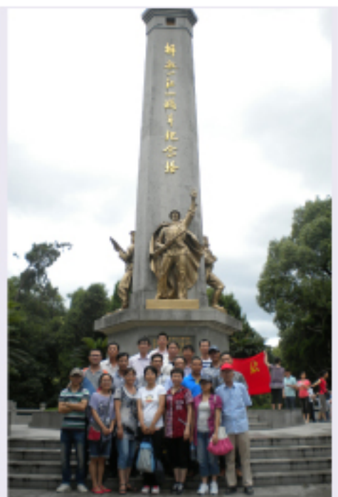
杭安公司组织党员及部分入党积极分子参观一江山战役纪念馆,缅怀革命先烈。