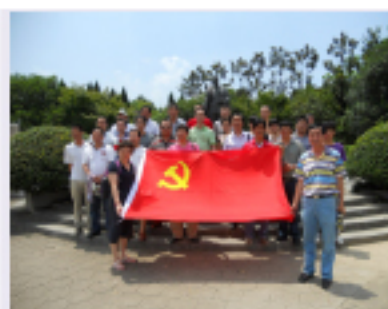
集团本部组织年度各先进中的党员参观温县新四军军部旧址,接受爱国主义教育。