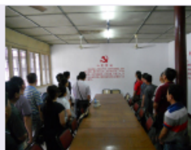
集团工程总支、机关支部在余姚浙东纵队司令部旧址重温入党誓词。