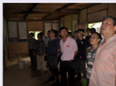
杭安公司党员及入党积极分子前往五泄景区秋崖坪,参观了全浙支队遗址。